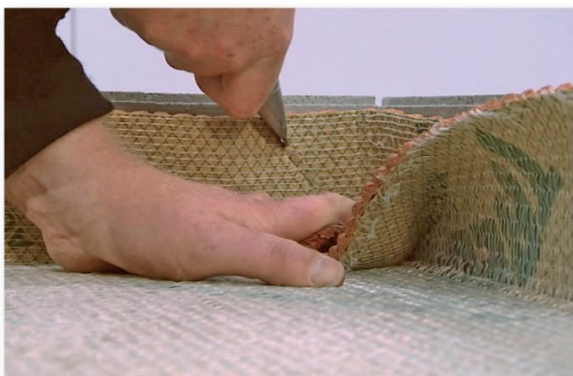
Skär till hörn och vinkla mattan upp mot väggen