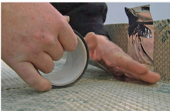
Tejpa samtliga skarvar med dB-Tejp