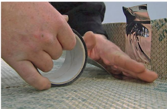
Tejpa samtliga skarvar med dB-Tejp