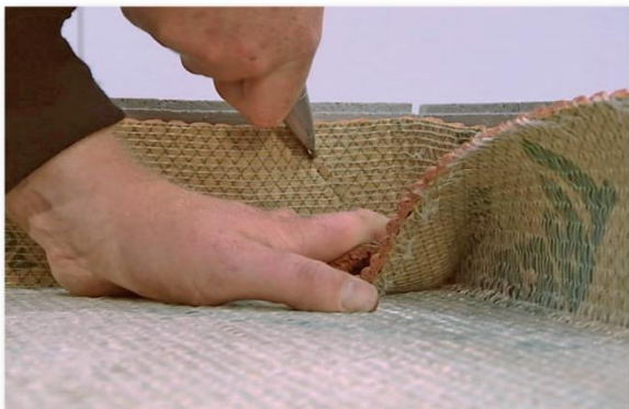
Skär till hörn och vinkla mattan upp mot väggen